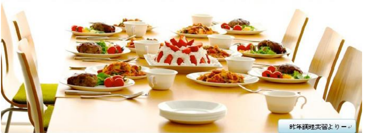
昨年調理実習よりー

日 時：平成30年 12月2日 （日）10：00～13：00 希望者～15：00 相談&交流会